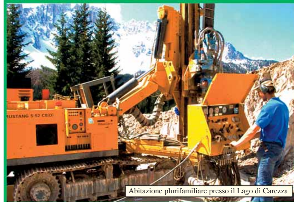
Abitazione plurifamiliare presso il Lago di Carezza

Durante l'iniezione delle sonde geotermiche, il foro e lo spazio anulare vengono completamente costipati, impedendo così l'accesso delle acque superficiali nella falda e il collegamento tra i diversi orizzonti acquiferi. L'iniezione è eseguita con sospensioni prive di sostanze tossiche, innocue per le acque e con proprietà termoconduttrici. La sospensione, portata verso l'alto attraverso un tubo d'iniezione, presenta un'elevata conduttività termica e caratteristiche plastico-elastiche, così che la sonda non venga danneggiata dai piccoli moti tellurici.