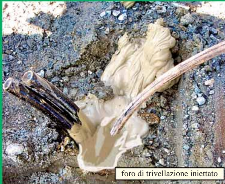
foro di trivellazione iniettato