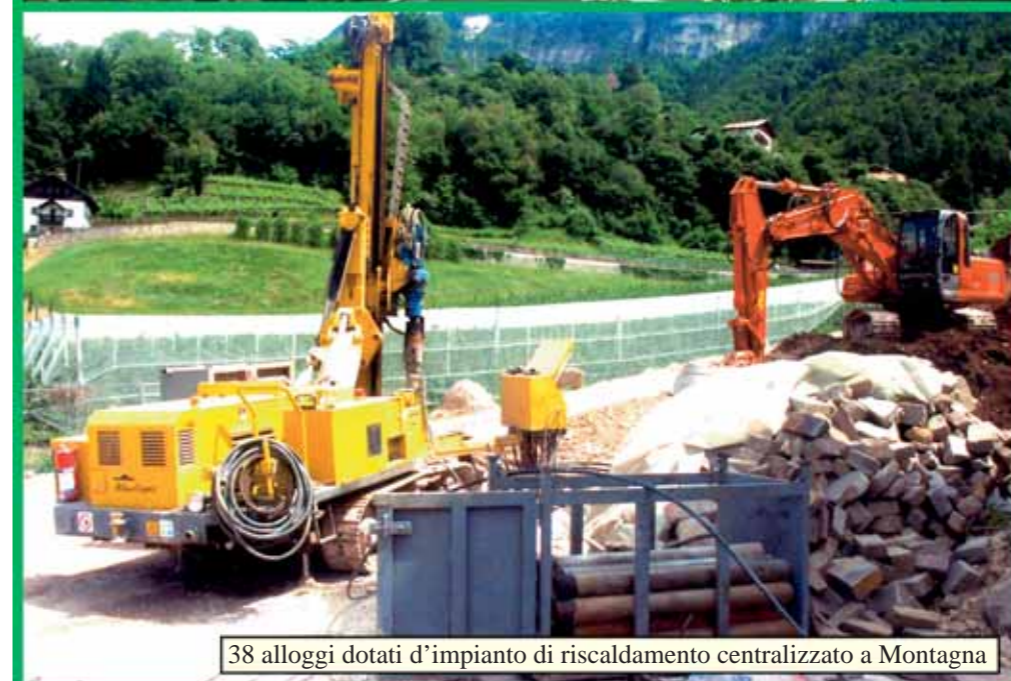
38 alloggi dotati d'impianto di riscaldamento centralizzato a Montagna