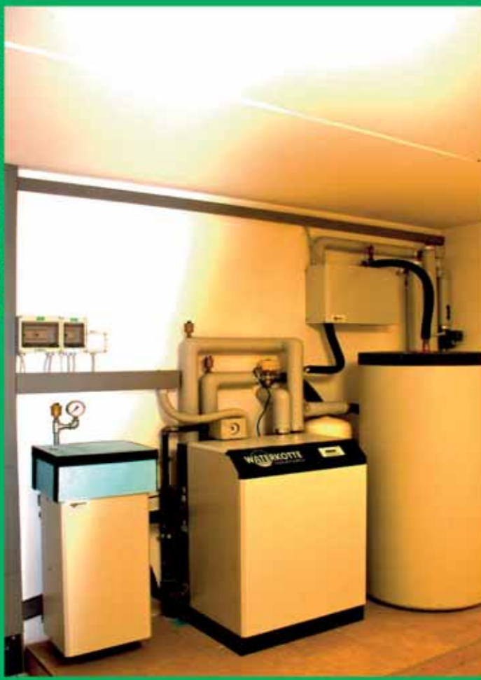
Struttura dell'impianto nella cantina di un'abitazione

La terra è ricca di energia: per sfruttarla adeguatamente, eseguiamo trivellazioni geotermiche nella vostra abitazione.