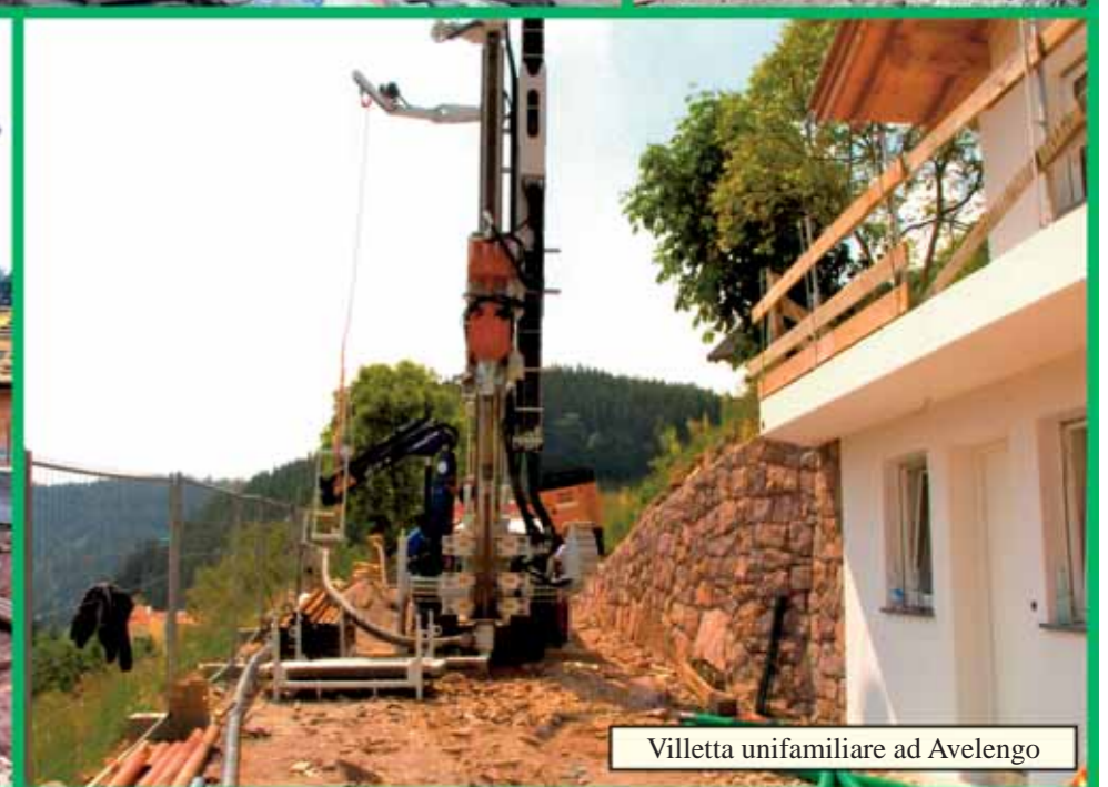
Villetta unifamiliare ad Avelengo