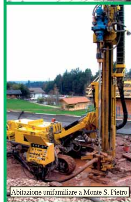
Abitazione unifamiliare a Monte S. Pietro